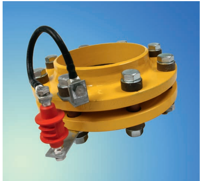
Рис. 4. Пример шунтирования изолирующего фланцевого соединения с помощью разделительного искрового разрядника EXFS 100

Разрядники EXFS 100... имеют взрывозащищенное исполнение и могут использоваться во взрывоопасных зонах класса 1 согласно ГОСТ Р 51330.9-99. Пропускная способность по току молнии равна 100 кА (10/350 мкс), что соответствует классу H согласно [2], т.е. максимально тяжелому режиму работы. Выдерживаемое напряжение промышленной частоты составляет 250 В, а номинальное импульсное пробивное напряжение – 1250 В. Разрядник EXFS 100 имеет стандартное исполнение для применения на наземных участках трубопроводов. Для удобства его монтажа предлагаются плоские и угловые крепежные скобы из оцинкованной стали с различными диаметрами отверстий под шпильку фланцевого соединения, а также, медные соединительные проводники длиной 100, 200 или 300 мм в комплекте с кабельными наконечниками. Разрядник EXFS 100 KU более универсален и может применяться как для наземного, так и подземного монтажа за счет специальной водонепроницаемой оболочки. В состав конструкции входят также два соединительных проводника длиной 2 м и сечением 25 мм 2 . При необходимости длина проводников может быть уменьшена, что позволяет осуществлять монтаж разрядников на фланцевые соединения различных габаритов. Пример установки разделительного искрового разрядника EXFS 100 на ИФС показан на рис. 4.