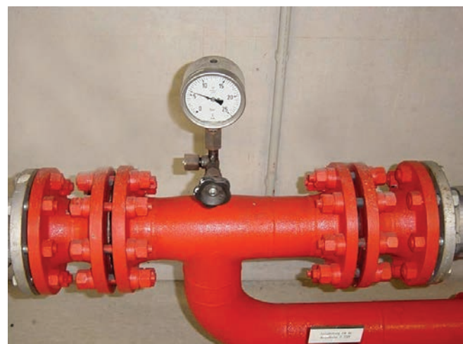
Рис. 2. Изолирующее фланцевое соединение